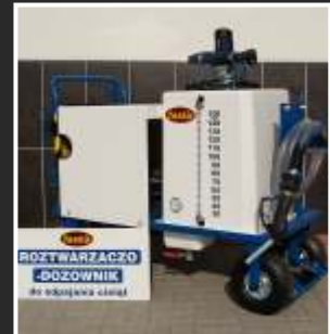
ROZTWARZACZKO-ODPAJANIE ODPAJANIE CIELĄT