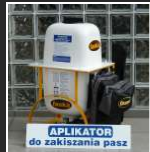
APLIKATOR do zakiszania paszy