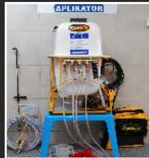
APLIKATOR ZAPRAWIANIE ZIEMNIAKÓW